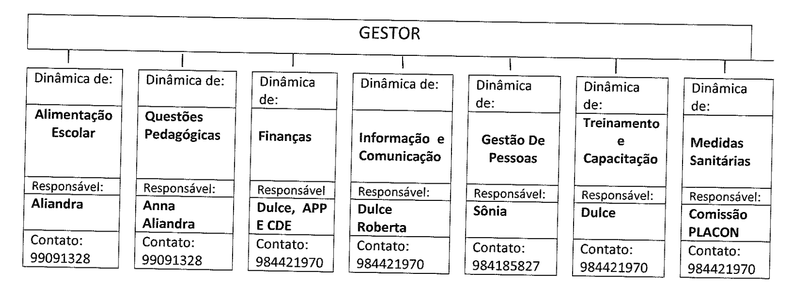
Figura 2: Organograma de um Sistema de Comando Operacional (SCO).

A Unidade Educativa EEB Pero Vaz de Caminha adotou a seguinte estrutura de gestão operacional.