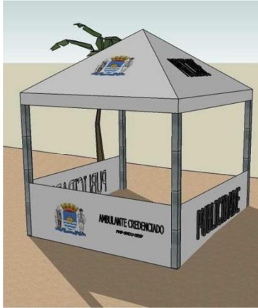
AMBULANTE CREDENCIADO PMF - SSP - SUSP