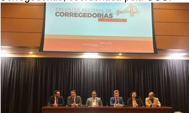
CGM participa do Encontro de Corregedorias

Atualmente, a CGM ocupa a Secretaria Executiva da Rede Nacional de Corregedorias, coordenada pela CGU.