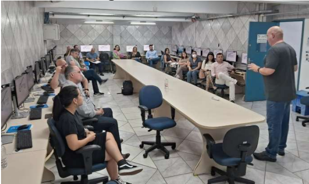
Treinamento foi realizado no dia 23 de outubro

A equipe do Controle Interno organizou, no dia 23 de outubro, um treinamento para utilização de novo sistema de armazenamento de informações para os integrantes de Conselhos Municipais. O objetivo da formação foi apresentar o novo sistema que será utilizado pelos conselhos como ferramenta de transparência das informações.