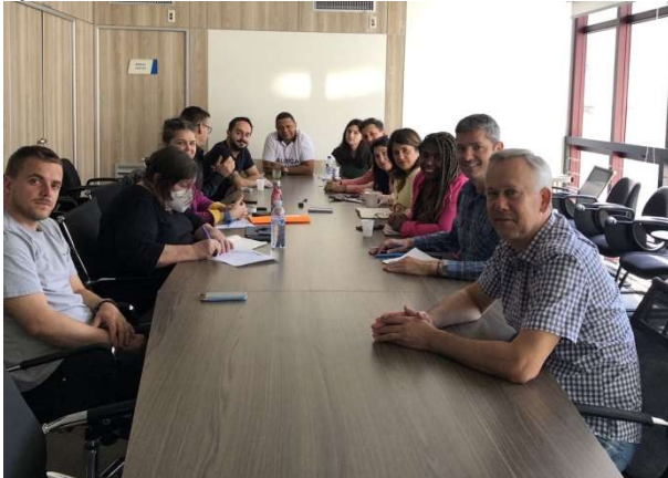
Encontro ocorreu na Fundação Franklin Cascaes

A controladoria participou de reunião no dia 10 de outubro para tratar do regramento do Edital da Lei Paulo Gustavo. O encontro foi realizado na Fundação Franklin Cascaes e contou com a participação dos técnicos responsáveis pela avaliação das propostas apresentadas.