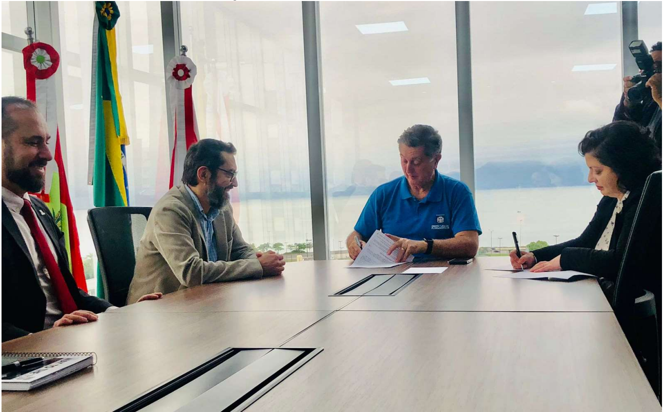
Prefeito Topázio assina Acordo de Cooperação Técnica entre Controladorias de Florianópolis (CGM) e da União (CGU)

A Prefeitura de Florianópolis firmou nesta segunda-feira, 16 de outubro, acordo de cooperação técnica entre a Controladoria-Geral do Município (CGM) e a Controladoria-Geral da União (CGU), com o objetivo de ampliar a troca de informações entre os dois órgãos, por meio de intercâmbio técnico, treinamentos, compartilhamento de bases de dados e outras tecnologias, como softwares para aprimoramento de procedimentos. A parceria visa a prevenir a ocorrência de atos ilícitos e aumentar a transparência.