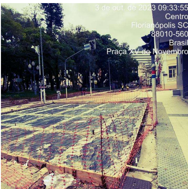
Entorno da praça XV de novembro

Na ocasião a equipe da CGM comparou o andamento da execução da obra com o pactuado em contrato.