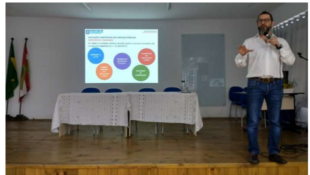
Encontro foi realizado no dia 29 de setembro

O primeiro módulo do treinamento já havia sido realizado no dia 5 de setembro.