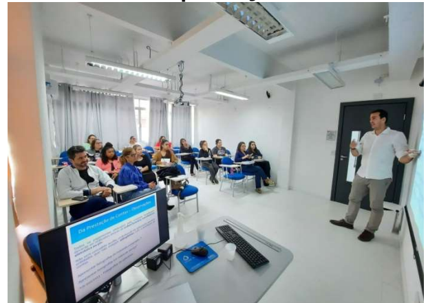
Formação foi realizada no dia 27 de setembro

A equipe do Controle Interno realizou, no dia 27 de setembro, mais um curso sobre Prestação de Contas de recursos repassados através de subvenções sociais, auxílios e contribuições para as Organizações da Sociedade Civil (OSCs) que possuem parceria com o município.