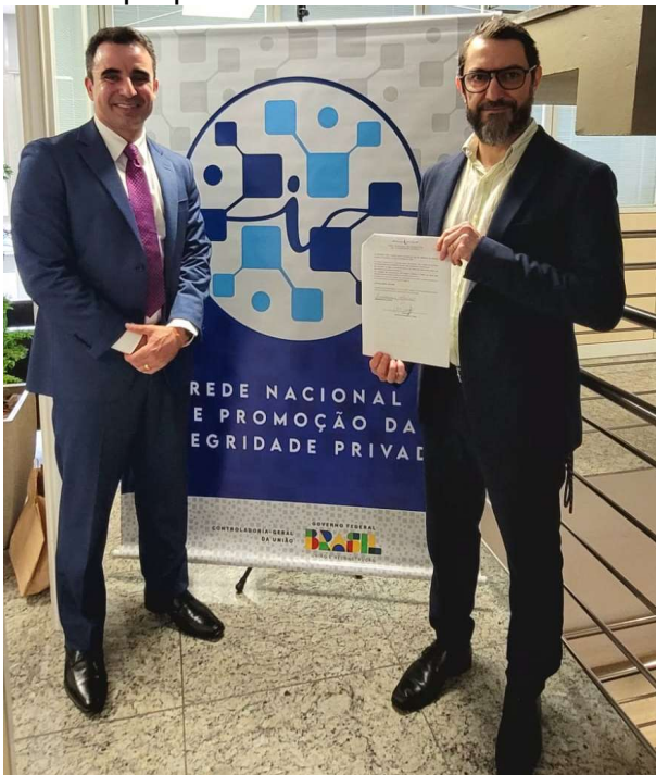
Controlador-Geral do Município formaliza adesão à Rede Nacional de Fomento à Integridade privada com a Secretaria Nacional de Integridade Privada

A Prefeitura de Florianópolis, por meio da Controladoria-Geral do Município (CGM), formalizou, no dia 19 de outubro, a adesão do município à Rede Nacional de Fomento à Integridade Privada, coordenada pela Controladoria-Geral da União (CGU). O objetivo da Rede é ampliar a troca de informações, o intercâmbio de técnicas, normas, modelos e expertises de atuação, além de desenvolver projetos de estímulo à ética e integridade para o setor privado, tanto para as grandes empresas como para as micro e pequenas.