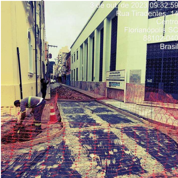
Obras na Rua Tiradentes

A Auditoria-Geral do Município realizou uma nova visita de fiscalização e monitoramento às obras de revitalização do entorno da Praça XV de novembro, do entorno do Terminal Cidade de Florianópolis e das ruas do Centro-Leste, no dia 3 de outubro.