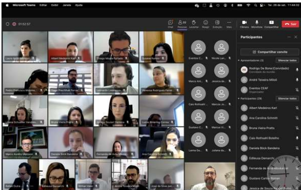
Encontro ocorreu no dia 26 de setembro

O Controlador-Geral de Florianópolis ministrou em 26 de setembro classe para mais de 30 promotores no módulo Tópicos Destacados da Atuação na Área da Moralidade Administrativa e Eleitoral, da Pós-Graduação do Ministério Público do Estado de Santa Catarina (MPSC) . O Tema da apresentação foi a Relevância de uma Atuação Conjunta entre Ministério Público e Controle Interno . O Controlador-Geral, que possui Mestrado em Administração pela UFSC e é Doutor em Economia e Governo pela Universidad Menéndez Pelayo, de Madrid, Espanha, apresentou os avanços da Controladoria-Geral desde sua criação, em 02 de janeiro de 2023.