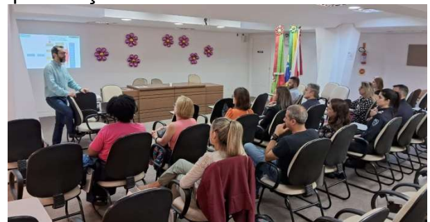
Reunião mensal com ouvidores dia 11 de outubro

Desde abril, as reuniões do Sistema Municipal de Ouvidoria são mensais e visam à padronização de procedimentos e qualificação do atendimento aos usuários.