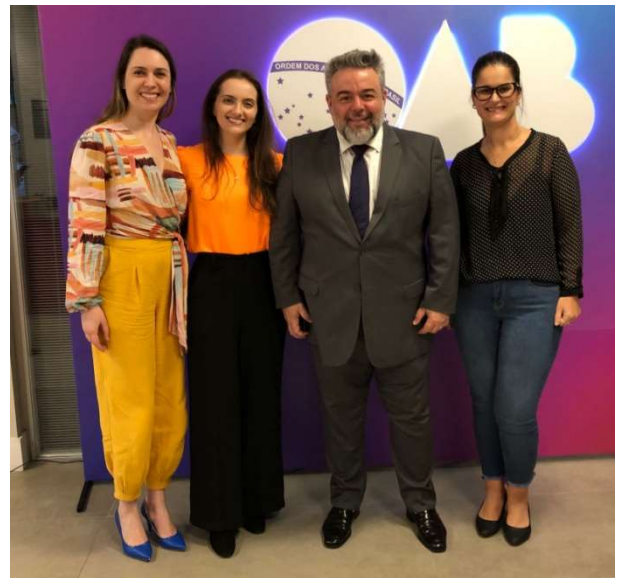
Evento foi realizado na OAB/SC

No encontro, técnicos da Autoridade Nacional de Proteção de Dados (ANPD) debateram temas como: regulação e proteção de dados pessoais, atuação fiscalizatória, tratamento de dados, penalidades da LGPD no setor público, entre outros.