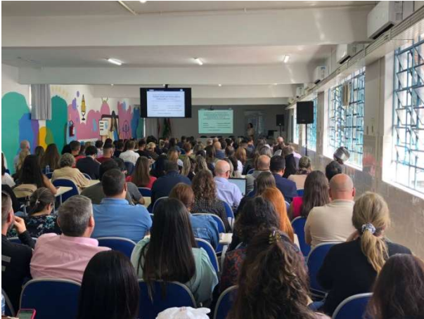
Evento teve a presença de mais de 220 servidores

A Controladoria-Geral do Município (CGM) realizou, no dia 14 de setembro, um Curso de Formação de Fiscais de Contratos. O evento ocorreu no Centro de Educação Continuada, da Secretaria Municipal de Educação e contou com a presença de mais de 220 servidores de diversas Secretarias e órgãos da Prefeitura.