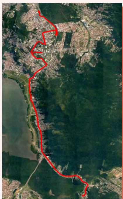
■ Trajeto sentido Bairro/TITRI

A linha teve seu itinerário sentido TITRI/TIRIO alterado da Rua Dep. Antônio Edu Vieira para a Rua Capitão Romualdo de Barros devido à implantação do binário.