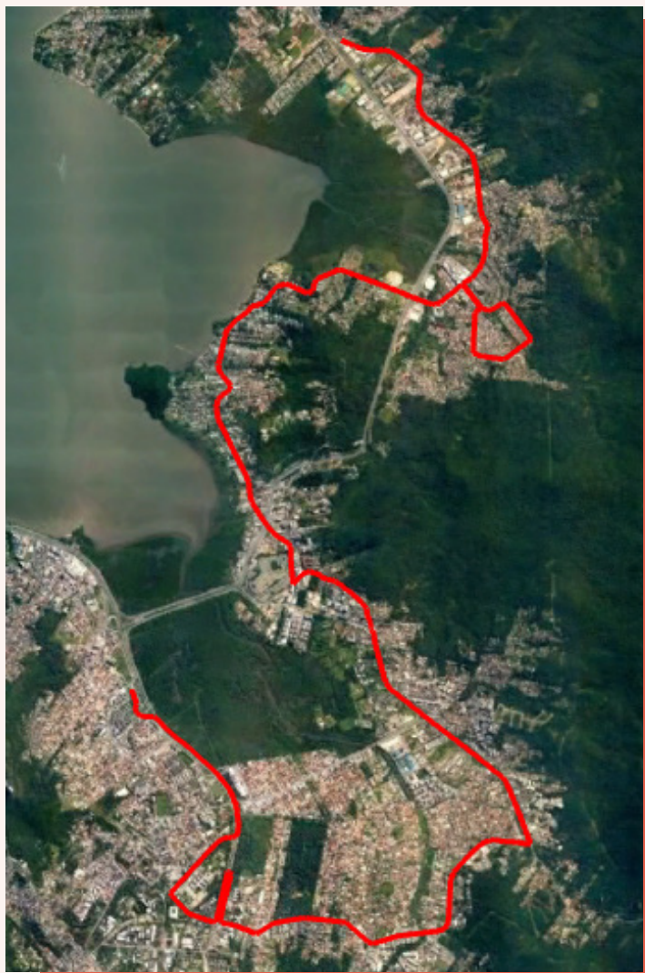
■ Trajeto sentido Bairro/TITRI

A linha teve seu itinerário alterado no sentido TITRI/Bairro , passando agora pelo Rua Delfino Conti e não mais por dentro da universidade.