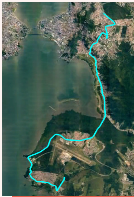
■ Trajeto sentido TITRI/Bairro