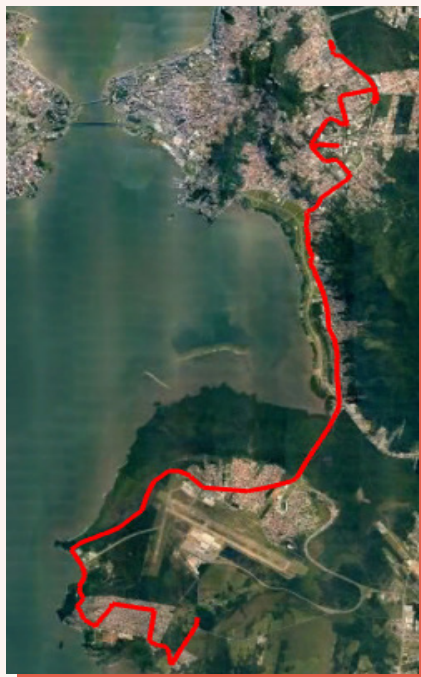
■ Trajeto sentido Bairro/TITRI

A linha teve seu itinerário TITRI/Bairro alterado da Rua Dep. Antônio Edu Vieira para a Rua Capitão Romualdo de Barros devido à implantação do binário.