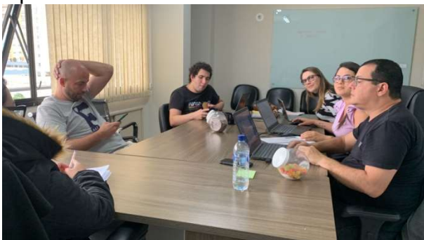
Reunião de trabalho realizada no dia 08 de agosto

A Controladoria-Geral do Município (CGM) está participando da comissão de seleção de parcerias de emendas parlamentares com as Organizações da Sociedade Civil (OSCs). A CGM também orienta as Unidades Gestoras quanto à apresentação da prestação de contas destes projetos, realizados em parceria com o município, que utilizam recursos repassados oriundos das emendas.