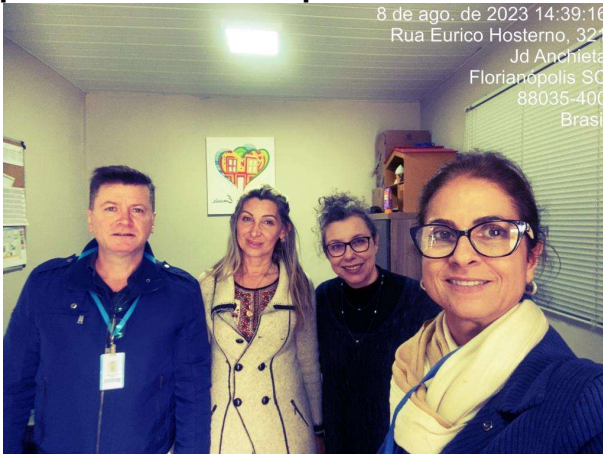
Ação Social Missão recebe visita da CGM

A Controladoria-Geral do Município, (CGM), através da Subcontroladoria-Geral de Auditoria realizou, no dia 08 de agosto, uma visita de monitoramento aos projetos realizados pela Organização da Sociedade Civil (OSC), Ação Social Missão, localizada no bairro Santa Mônica, em Florianópolis.