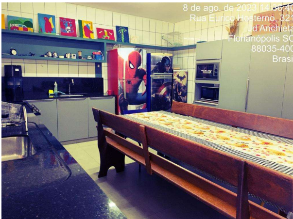
Entidade é parceira da Educação e Assistência

A fiscalização das parcerias do município com as OSCs é uma ferramenta importante de controle do município. Somente no ano de 2023 a Prefeitura já repassou, ou tem previsão de repasse, aproximadamente 95 milhões de reais.