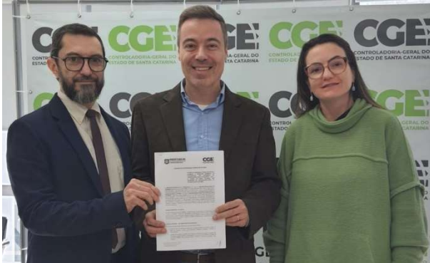
CGE e CGM assinam acordo de cooperação

A Controladoria-Geral do Município (CGM) e a Controladoria-Geral do Estado (CGE) assinaram, no dia 13 de julho, um Acordo de Cooperação que cria mecanismos de assistência mútua para o desenvolvimento de ações nas áreas de controle interno, auditoria, corregedoria, ouvidoria e transparência.