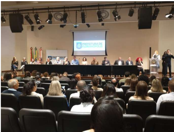
Evento teve a Participação do Prefeito Municipal

O debate tratou sobre o papel institucional, bem como o papel dos servidores que atuam nas unidades de serviços e atendimento às crianças e adolescentes.