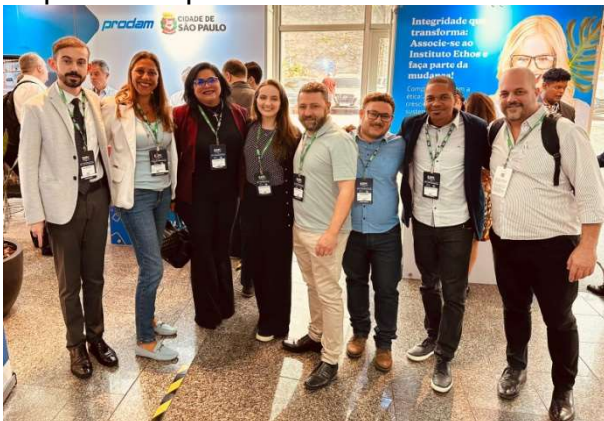
Evento ocorreu em São Paulo (SP)

Além da relevância dos temas abordados, o Fórum é um importante canal institucional de aproximação entre os municípios e a Autoridade Nacional de Proteção de Dados (ANPD) órgão responsável pelo tema na esfera federal.