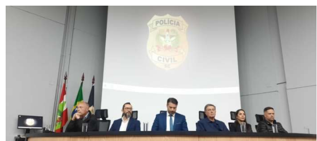
Evento foi realizado no dia 25 de agosto