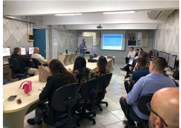
Treinamento foi realizado nos dias 7 e 8 de agosto

A Controladoria-Geral do Município de Florianópolis (CGM) promoveu nos dias 7 e 8 de agosto o Módulo I do Curso de Formação em Análise de Prestações de Contas de recursos repassados para Organizações da Sociedade Civil (OSCs) com base na Lei Federal nº 13.019/2014, que regulamenta o regime jurídico das parcerias entre a Administração Pública e as OSCs.