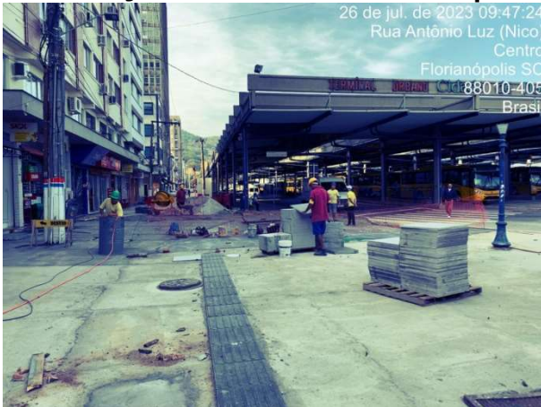
Entorno do Terminal Cidade de Florianópolis

A Auditoria-Geral do Município realizou no dia 26 de julho, uma visita de fiscalizações obras de revitalização dos entornos da Praça XV de novembro e do Terminal Cidade de Florianópolis.