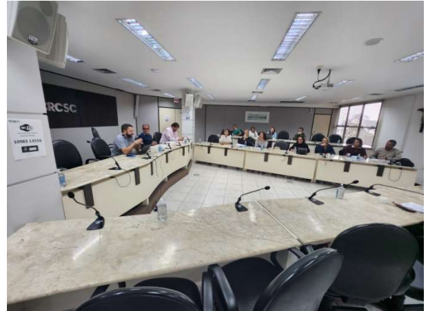
Evento do dia 10 de agosto foi realizado no CRC

A Ouvidoria-Geral realizou nos dias 13 de julho e 10 de agosto mais dois encontros de treinamento e orientação com os representantes das Ouvidorias Setoriais das Secretarias e Órgãos do Município.