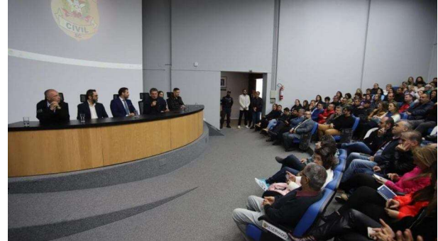
Evento foi realizado no dia 25 de agosto

A Prefeitura Municipal de Florianópolis, a Controladoria-Geral do Município (CGM) e a Polícia Civil do Estado de Santa Catarina (PCSC) realizaram no dia 25 de agosto o “Seminário de Boas Práticas Digitais e Probidade no Serviço Público”. O evento contou com a presença de quase 300 servidores municipais de todas as áreas, que participaram de uma formação na Academia de Polícia Civil (Acadepol).