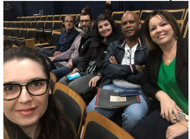
Equipe da CGM presente no TCE/SC

A CGM esteve presente na etapa de Florianópolis e participou das oficinas técnicas, ministradas por auditores fiscais de controle externo do TCE/SC, com objetivo de oportunizar aos técnicos do controle interno do município a ampliação de conhecimento na sua área de atuação.