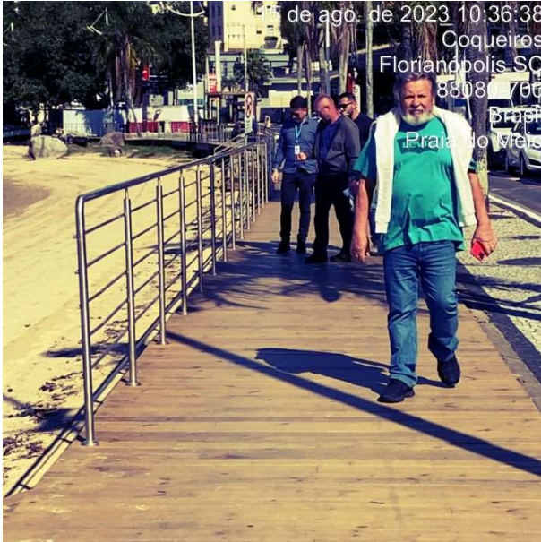
Obras receberam visita da CGM

No dia 15 de agosto, a equipe da Subcontroladoria de Auditoria realizou uma fiscalização as obras de revitalização das praias da Saudade, do Meio e do Riso, todas no Bairro Coqueiros, na parte Continental do município. As obras fazem parte do Contrato nº 273/SMI/2022 e a visita foi acompanhada pelo engenheiro responsável pela fiscalização do contrato.