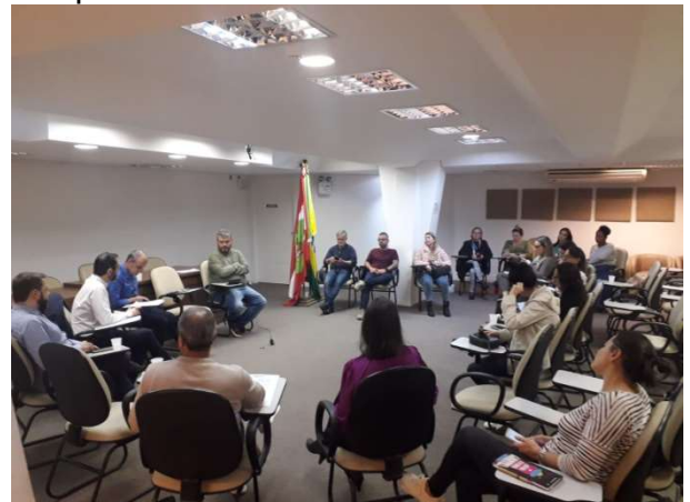
Auditório da Semas recebeu encontro de julho

No encontro do dia 10 de agosto o tema principal foi o tratamento e tramitação das manifestações dentro do sistema FalaBr. Já no encontro do dia 13 de julho, o tema central foi o Decreto n. 25.240/2023, que trata do tratamento de manifestações. Em todos os encontros são realizados estudos de casos e as dúvidas são compartilhadas e debatidas objetivando sempre o melhor atendimento ao usuário.