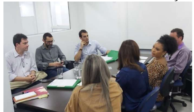
Reunião ocorreu na sede da Controladoria-Geral

A Controladoria-Geral do Município (CGM) se reuniu, no dia 16 de agosto com a Secretaria Executiva de Desenvolvimento Econômico, Ciência e Tecnologia para tratar das parcerias entre o município e os proponentes selecionados em virtude da Lei de Incentivo à Inovação.