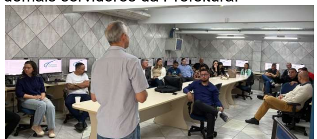
Curso ocorreu no Centro de Educação Continuada

O objetivo da formação foi orientar os servidores responsáveis pela análise de prestação de contas dos projetos de parcerias que recebem recursos do município, passando a experiência da Controladoria-Geral no tema para os demais servidores da Prefeitura.