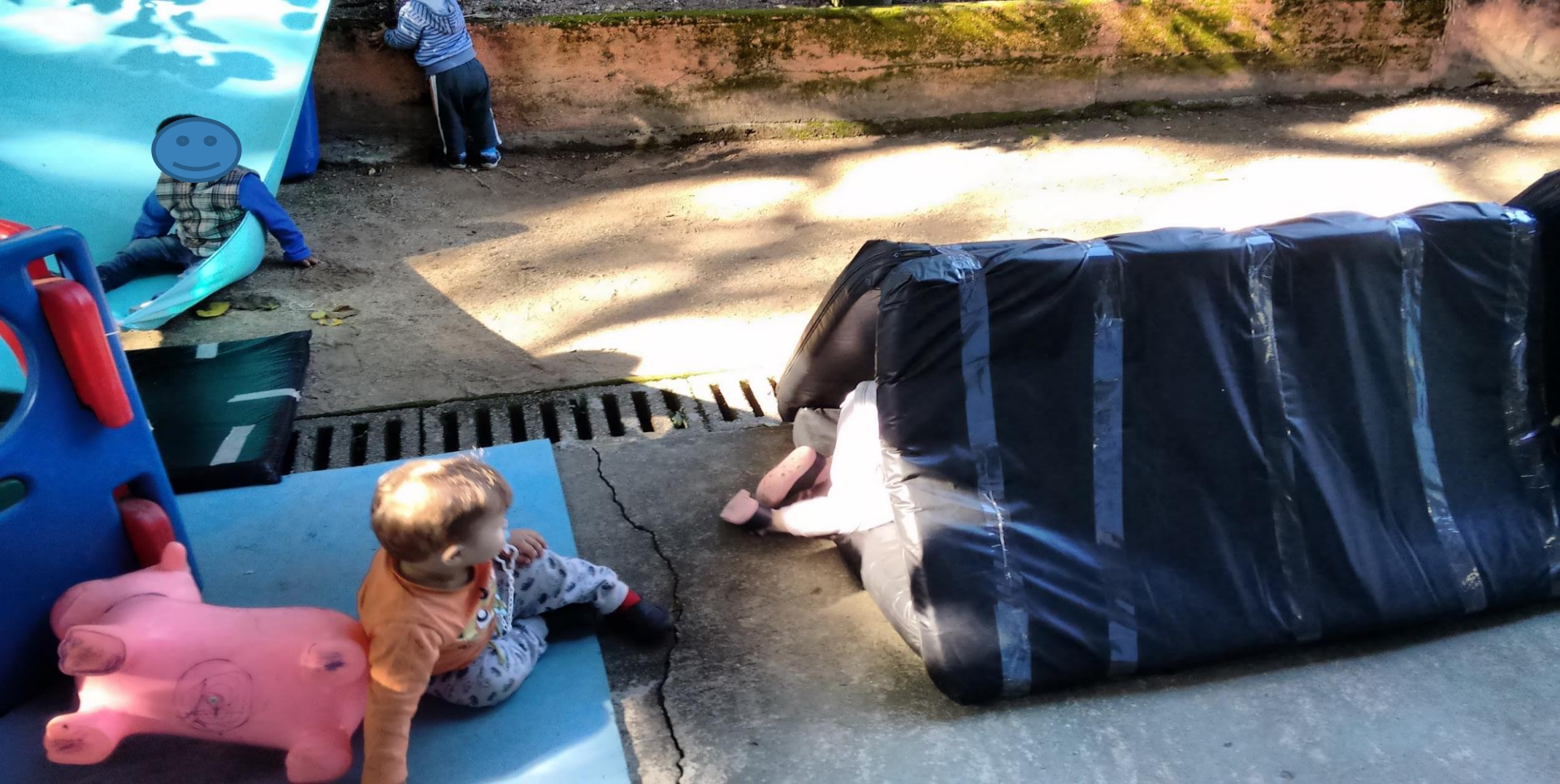
Atividade área externa