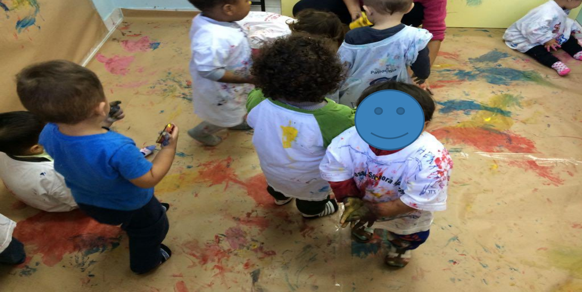
Atividade sala referência