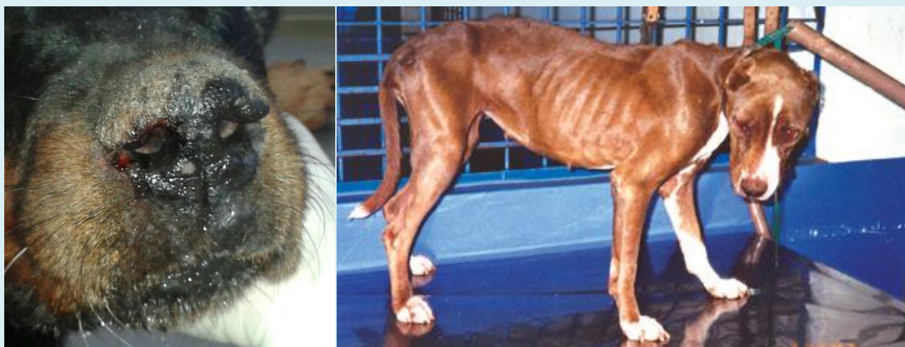
Figuras 2 e 3: Lesões em focinho de cão. Fonte: Arquivo CCZ/Florianópolis; Cão aparentando emagrecimento e apatia. Fonte: Manual de Vigilância e Controle da Leishmaniose Visceral, Ministério da Saúde, 2014.

descamação na região ao redor dos olhos, focinho e ponta de orelhas além do crescimento exagerado das unhas. Pode ocorrer também conjuntivite ou outros distúrbios oculares (figuras 2, 3, 4 e 5). Com o passar do tempo o animal fica cada vez mais magro e debilitado, com aumento de volume na região abdominal, diarreia, hemorragia intestinal, caquexia, inanição e morte na fase final da doença. Esses sinais clínicos não são específicos da LVC, portanto, sempre que o cão apresentar qualquer sinal diferente de seu estado normal deve-se procurar um Médico Veterinário que fará um exame laboratorial para diagnosticar a doença.