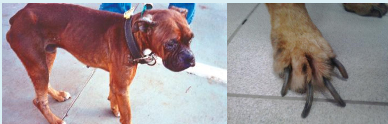
Figuras 4 e 5: Cão com emagrecimento, ceratoconjuntivite, lesões de face e orelha. Fonte: Manual de Vigilância e Controle da Leishmaniose Visceral, Ministério da Saúde, 2014; Onicogrifose (crescimento exagerado das unhas) Fonte: arquivo CCZ/Florianópolis.