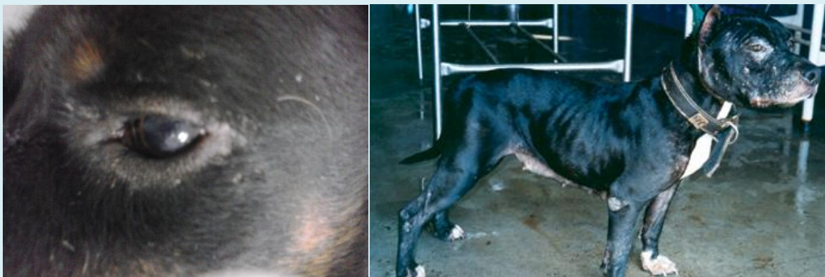
Figuras 6 e 7: Lesão no olho em cão. Cão com lesões de face e de orelha.

Nos seres humanos, os sintomas incluem febre, cansaço muscular, perda de apetite, emagrecimento e aumento do volume abdominal.