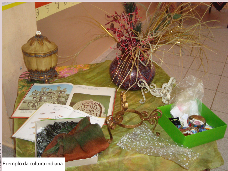
Exemplo da cultura indiana