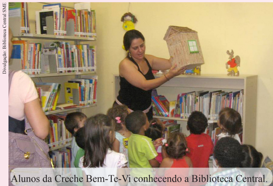
Alunos da Creche Bem-Te-Vi conhecendo a Biblioteca Central.

No dia 12 de março é comemorado o Dia do Bibliotecário, o profissional que organiza as bibliotecas e ajuda na preservação de livros, revistas e outros materiais. Ele trabalha não só em bibliotecas, mas em centros de documentação e atua no gerenciamento de redes e sistemas de informação. A rede municipal de ensino de Florianópolis conta com 31 desses profissionais.