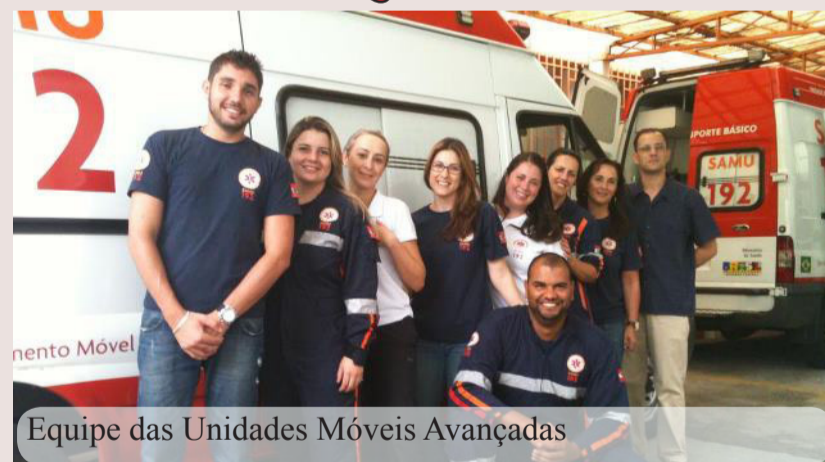
Equipe das Unidades Móveis Avançadas

Na quinta-feira (14/03) iniciaram-se as atividades do projeto “Educação e Samu: Educando para Salvar”, através da Escola Básica Municipal Batista Pereira, no Ribeirão da Ilha. A parceria é da Secretaria Municipal de Educação de Florianópolis com o Serviço de Atendimento Móvel de Urgência (SAMU) da Secretaria de Estado da Saúde.