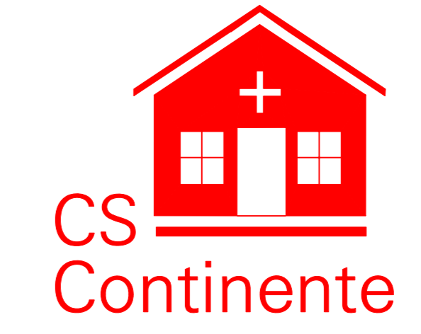
Localização do Centro de Saúde Capoeiras