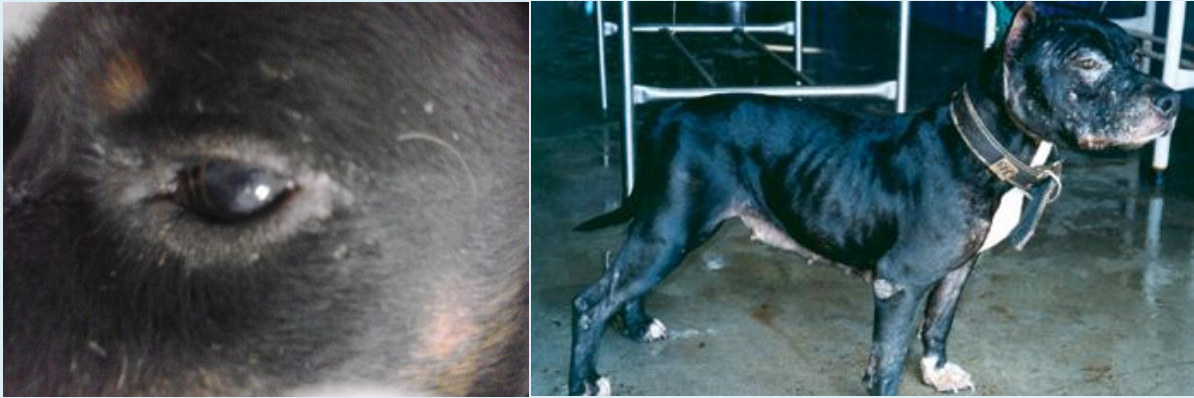
Figuras 6 e 7: Lesão no olho em cão. Fonte: arquivo CCZ/Florianópolis; Cão com lesões de face e de orelha. Fonte: Manual de Vigilância e Controle da Leishmaniose Visceral, Ministério da Saúde, 2014.

Nos seres humanos, os sintomas incluem febre, cansaço muscular, perda de apetite, emagrecimento e aumento do volume abdominal.