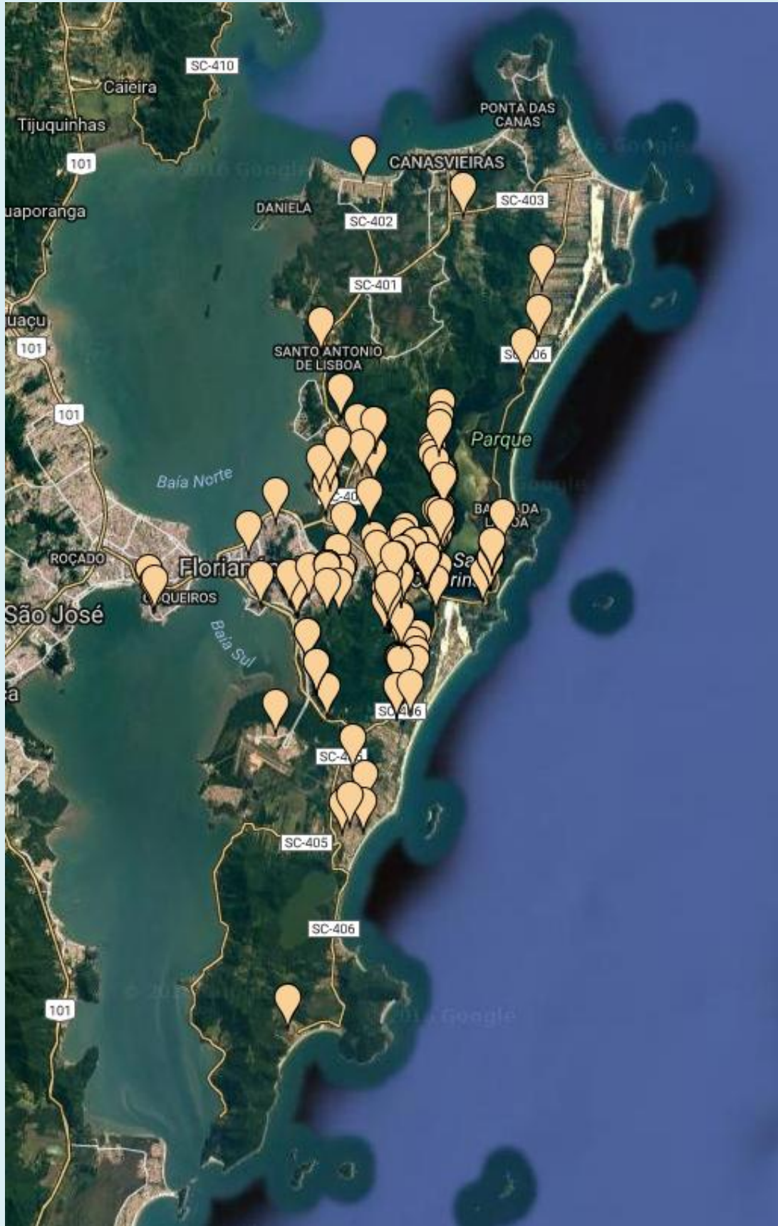
Figura 7: Mapeamento de cães positivos em Florianópolis