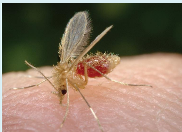
Figura 1: Fêmea de Flebotômio adulto ingurgitada (foto ampliada).

A transmissão da leishmaniose se dá pela picada de um inseto do gênero Lutzomyia popularmente chamado de mosquito-palha (figura 1), que coloca seus ovos em matéria orgânica em decomposição. Por isso, locais com fezes de animais, cascas ou restos de plantas e lixo orgânico (lixo não reciclável), por exemplo, podem ser favoráveis para a ocorrência desse inseto.