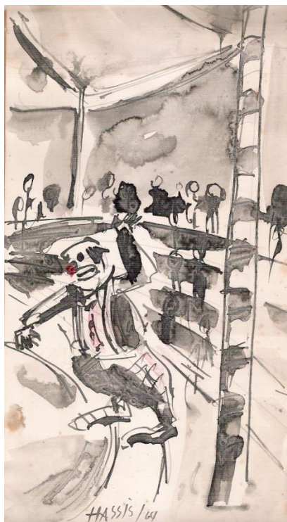
Figura 1 - Circo