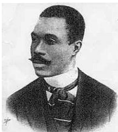
Figura 5- Cruz e Sousa