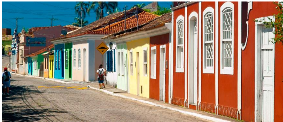
Figura 4- Ribeirão da ilha