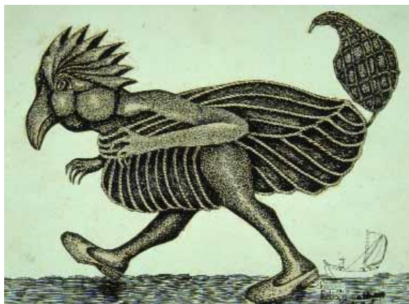
Figura 3- Desenho por Franklin Cascaes