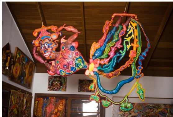
Figura 2: Mulher no Espaço